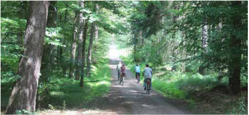
Förderprojekt 2014: Lehrpfad im Wernsdorfer Wald Funded in 2014: A new trail in Wernsdorf forest

590.000 Euro gefördert werden. Die Menschen vor Ort sind eingeladen, die Veränderungen aktiv mitzugestalten.