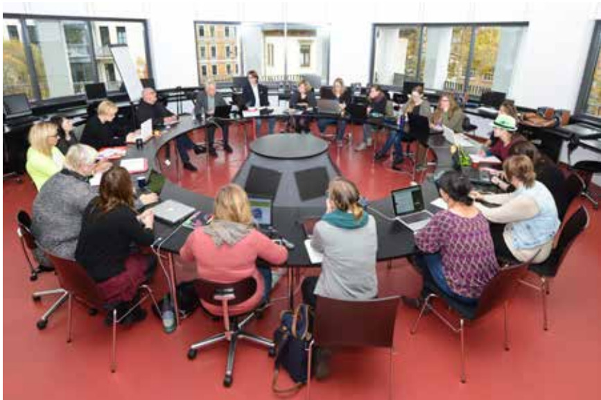
Leipzig School of Media