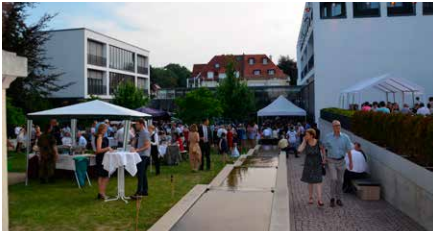
MedienCampus Villa Ida: Sommerfest 2015 Media Campus Villa Ida: Summer Party 2015

Further information: www.medien-campus-villa-ida.de