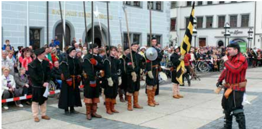
Förderprojekt 2013: Der Schaukampfung „Faust Luthers“ aus Torgau Funded in 2013: Reenactment group "Faust Luthers" from Torgau

Since its beginning, this Sparkasse foundation has supported and funded many projects, associations, and initiatives. Up to now, it has been able to finance more than 150 projects with a total of roughly 590,000 euros. The foundation seeks to