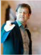
Picturesque