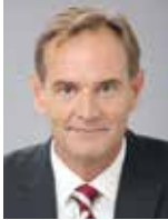
Stadt Leipzig City of Leipzig

Burkhard Jung Oberbürgermeister der Stadt Leipzig Lord Mayor of the City of Leipzig