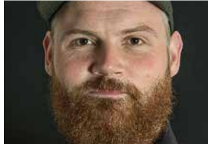
Leipzig School of Media