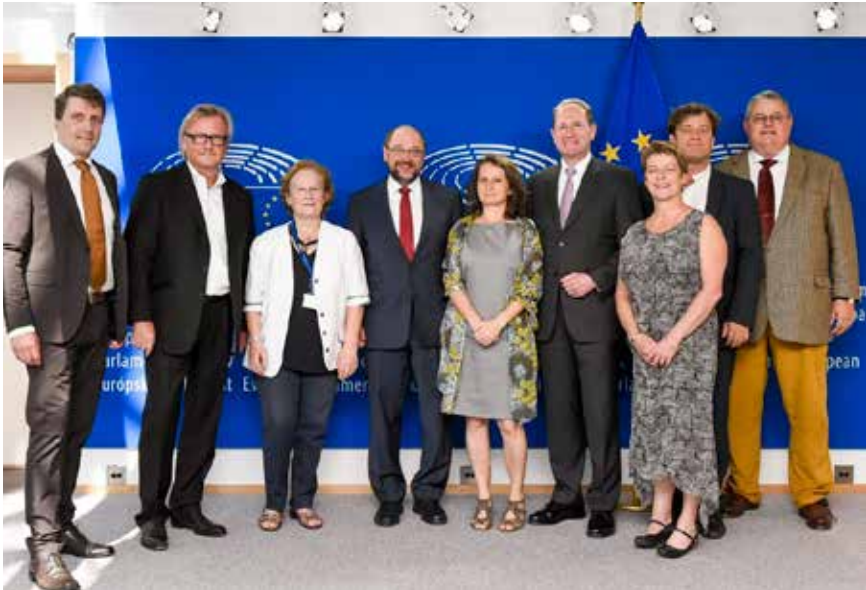
Europäisches Parlament/European Parliament