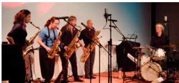
Campus-Konzert 18. April 2015: The Tiptons Sax Quartet plus drums Campus concert 18 April, 2015: The Tiptons Sax Quartet plus drums

Seit 2011 produziert und veröffentlicht die Stiftung Mitschnitte der Konzerte in loser Folge in ihrer Edition campus inter|national:live.